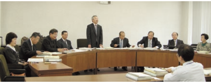
千葉県議会での調査の様

務調査費の更なる透明化を図るなど、議会改革についての申し入れを行いました。会派内では活発な意見交換をし、常に課題を共有し県民の皆さんが中心の県政づくりに務めています。