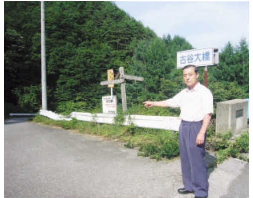
299号から分かれる林道大上線